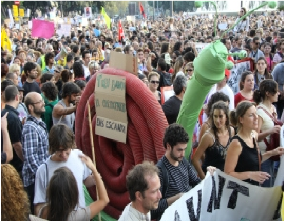
A partir d'un text d'Ivan Illich, el cargol va esdevenir el símbol del decreixement

sabàtics”, però és la reducció de la jornada laboral la que, a més, facilita el repartiment de les feines de la llar) i combatre les hores extra.